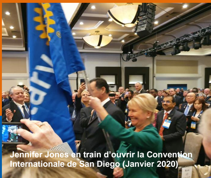
Jennifer Jones en train d'ouvrir la Convention Internationale de San Diego (Janvier 2020)